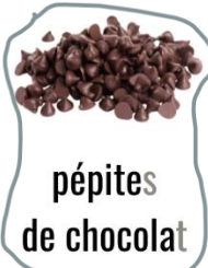
pépites de chocolat