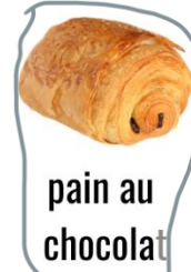
pain au chocolat